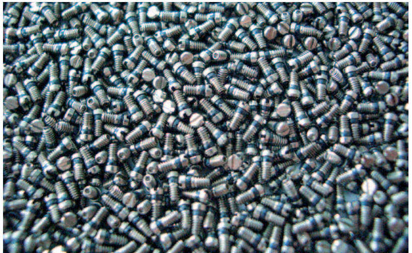
Über 100 Mio. Sicherungsschrauben werden pro Jahr gefertigt

Das im Jahr 1904 gegründete international tätige Familienunternehmen OBE Ohnmacht & Baumgärtner GmbH & Co. KG ist seit 1996 nach ISO 9001 und ISO/TS 16949 zertifiziert und betreibt seit Jahren ein professionelles Umweltmanagement nach ISO 14001 sowie EMAS. Weltweit beschäftigt OBE 450 Mitarbeiter, davon rund 200 am Hauptsitz in Ispringen, und ist mit Tochterunternehmen in Italien, Hongkong und China sowie Repräsentanzen weltweit vertreten. Seit April 2016 hat OBE die bisherige Beteiligung am asiatischen Brillenscharnierhersteller GLOBE Precision Ltd. zu 100 % übernommen. OBE kann zahlreiche Patente im Bereich der Brillenindustrie sein eigen nennen und beweist damit eine große Innovationskraft.