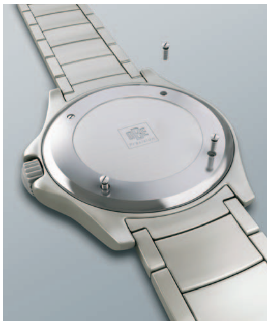
Nicht nur in jeder Ray-Ban-Brillenfassung stecken die OBE-Sicherungsschrauben