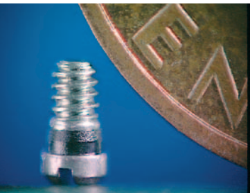
Kunststoffumspritzte Mikro-Sicherungsschraube im Größenvergleich

Zur Realisierung der Idee fanden zunächst bei verschiedenen Mühlenherstellern Mahlversuche statt. Dabei ergaben sich unterschiedliche Korngrößen des Mahlguts sowie unterschiedliche Staubanteile im Mahlgut. Diese Versuchsergebnisse wurden analysiert und mit den Eigenschaften des neuwertigen Kunststoffgranulats verglichen. Mit dem Mahlgut, das der Neuware am nächsten kam, wurden erste Spritzversuche mit den vorhandenen Spritzgussmaschinen durchgeführt. Die bei diesen Versuchen umspritzten Schrauben wurden eingehenden Produkttests unterzogen, um zu prüfen, ob sich am Endprodukt spürbare Veränderungen einstellen. Nachdem diese Untersuchungen zu einem positiven Ergebnis