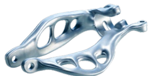
Beispiel Schmiedebauteil: Bionische Federbeingabel