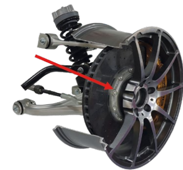
Bremsscheibentopf im Einbauszustand

Im Jahr 2020 sollten im Rahmen einer internen Forschungs- und Entwicklungsmaßnahme ein neues Legierungskonzept sowie alternative Vormaterialherstellungsrouten untersucht und deren Eignung anhand von Prototypen überprüft werden. Die internen Forschungsmaßnahmen beinhalteten Grundlagenuntersuchungen hinsichtlich der Eignung des Legierungskonzepts als Schmiedevormaterial. Des Weiteren wurde untersucht, ob die technologischen sowie optischen Anforderungen erfüllt werden können. Darüber hinaus wurden Lieferanten aufgebaut, um eine Verfügbarkeit des Materials für künftige Produkte sicherzustellen. Bei Erfolg der internen Maßnahmen sollte das neue Konzept an Kunden herangetragen und diese überzeugt werden.