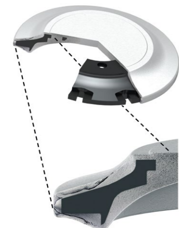
Bremsscheibentopf Schmiedehalbzeug und Fertigteil in Gefügedarstellung in der Schnittansicht