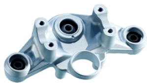
Beispiel Schmiedebauteil: Gabelbrücke

Es ist eben so viel leichter, Großes zu erreichen, wenn die Werte stimmen.