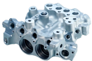
Beispiel Schmiedebauteil: Hydraulischer Ventilblock